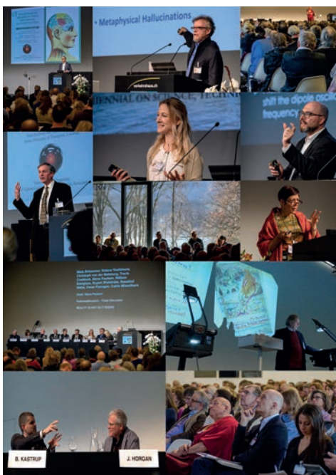
Photo-Impressionen Biennalen 2016 – 2020 – Photo impressions Biennials 2016 – 2020; Zweitunterste Photo rechts: Sir Roger Penrose, Nobelpreisträger 2020 in Physik, an der Biennale 2016 «Das Rätsel des Bewusstseins» – Second bottom photo right: Sir Roger Penrose, 2020 Nobel Laureate in Physics, at the Biennial 2016 “The Enigma of Consciousness”.

Keynotes and panel discussions with top speakers from the disciplines philosophy of mind, philosophy of science/history of science, neuroscience, physics, Indian and Tibetan Buddhist philosophy, religious studies, contemplative sciences, environmental philosophy, evolutionary ecology/plant cognition, systems theory, Post-Growth economy/Sufficiency research, and artificial intelligence research. Speakers from Australia, Canada, Germany, Switzerland, and USA.